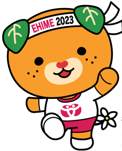
ねんりんピック えがお 愛顔の えひめ2023マスコット キャラクターみきやん