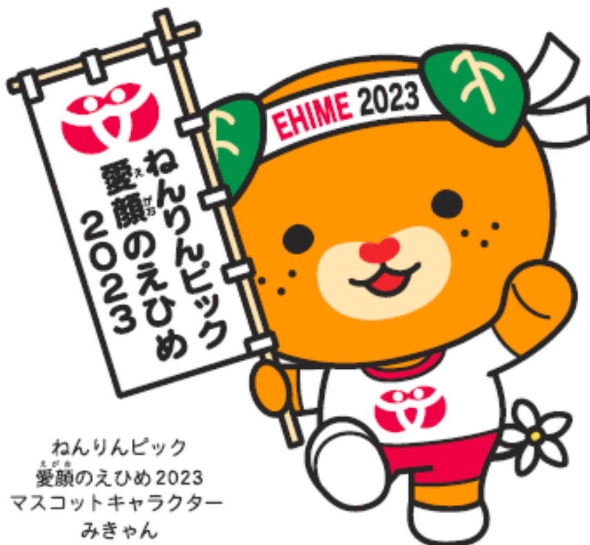
ねんりんピック 愛顔のえひめ2023 マスコットキャラクター みぎゃん