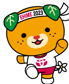
ねんりんピック愛顔のえひめ2023 マスコットキャラクター みきゃん